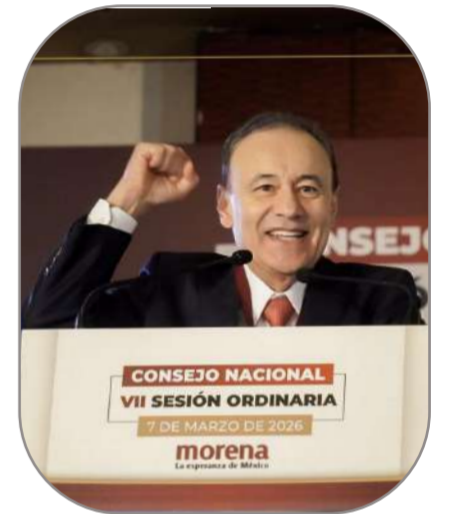
Alfonso Durazo, presidente del Consejo Nacional Morena

“En morena no hay cargos públicos sino encargos públicos, no se nos debe olvidar.”