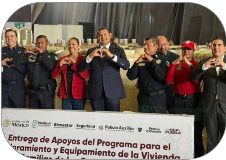
Se construye vivienda digna para policías, bomberos y brigadistas forestales. Un compromiso con sentido social.