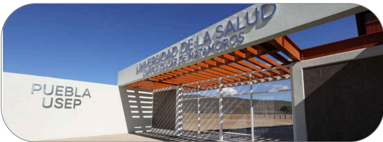
En Izúcar de Matamoros se construyó un nuevo campus de la Universidad de la Salud , para formar profesionistas de alta calidad.