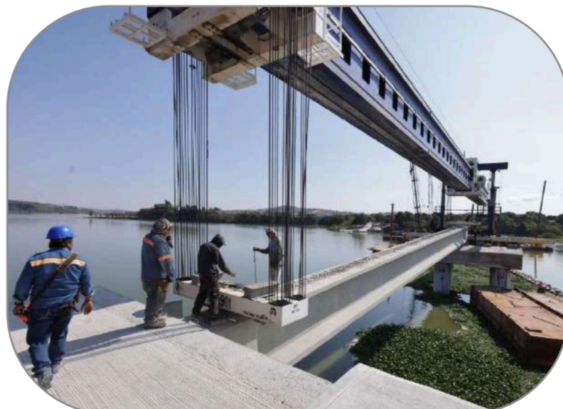
Magna obra, Puente de la Transformación , que sustituye a la tradicional Panga en el lago de Valsequillo.