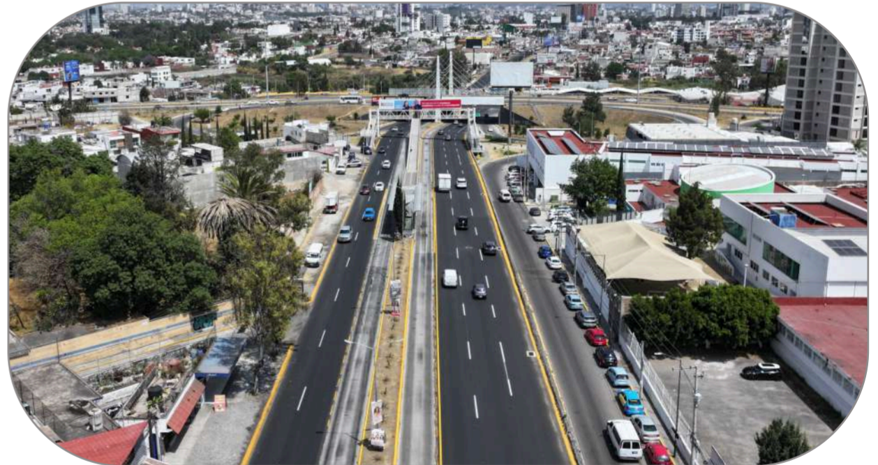
La rehabilitación de 33 vialidades en la zona metropolitana es en beneficio de 1.9 millones de habitantes.