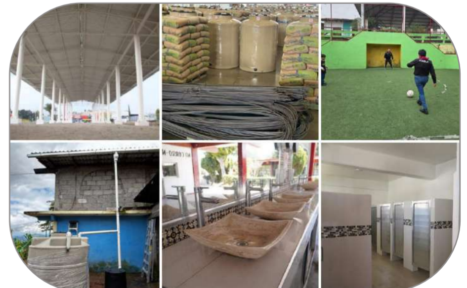
Con fondos de obra comunitaria se han construido techados, cambiado baños y bebederos escolares, mejorado vivienda e instalaciones deportivas.