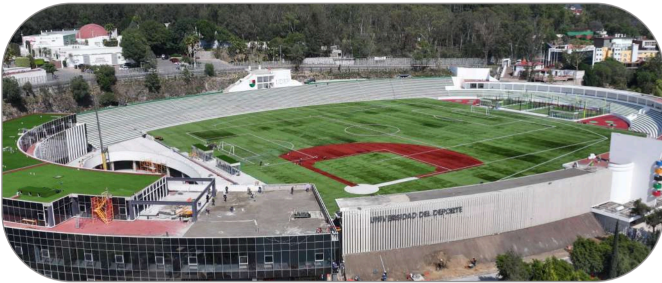
En apoyo a los jóvenes deportistas se construye la Universidad del Deporte con aulas, zona de residencia, canchas, alberca, gimnasio, comedor.