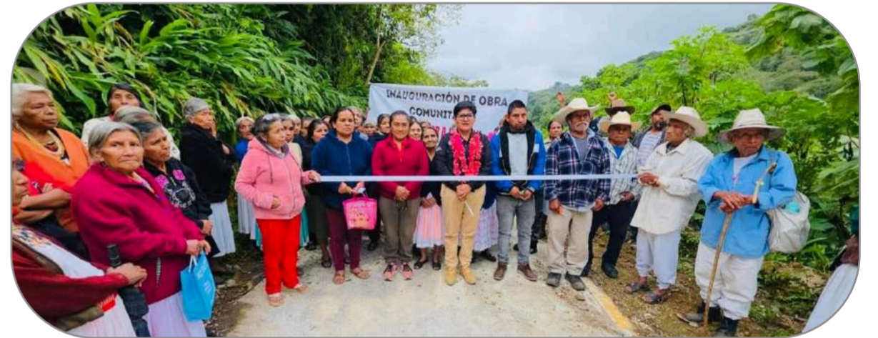
Obra comunitaria: Camino artesanal en la sierra norte construido con participación de la comunidad.