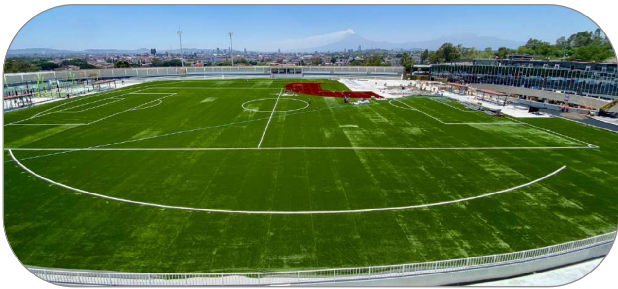
Universidad del Deporte Puebla

Esta obra reduce el tiempo de traslado a sólo un minuto. Además, el puente impactará en la economía local al facilitar el acceso a servicios de salud, potencia el comercio agrícola y detonar el turismo en la Ruta del Mezcal.