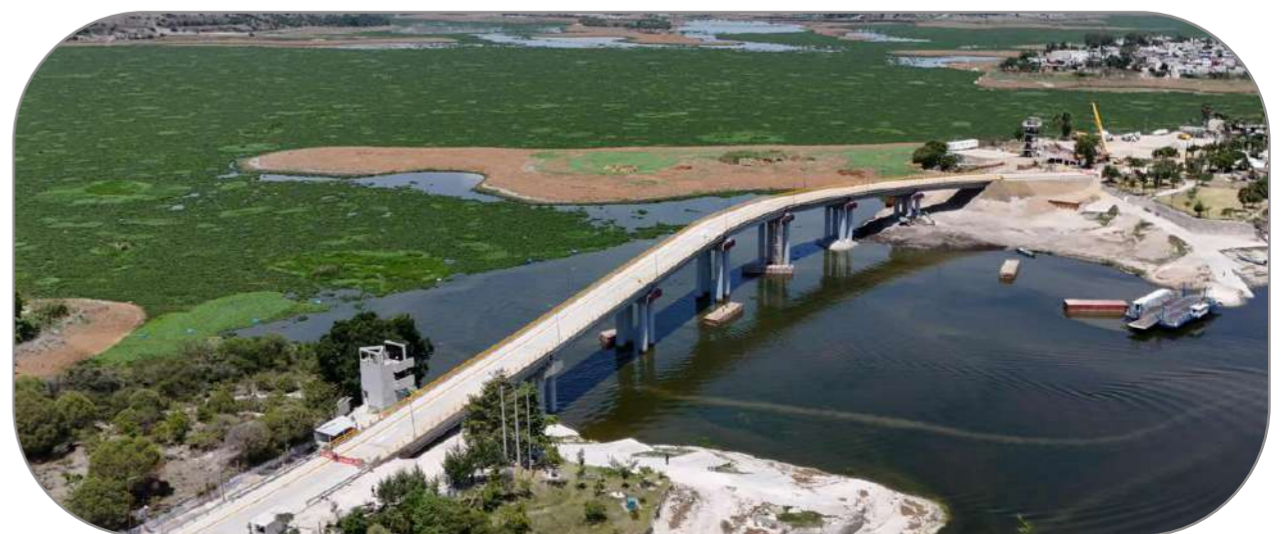
Puente de la Transformación

Luego de 7 décadas de espera, el puente de la transformación le cambia la vida a la gente.